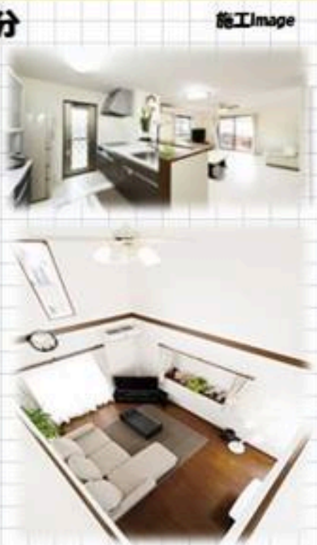
[A区画建物プラン] 建物価格1,900万円 建物価格4,180万円